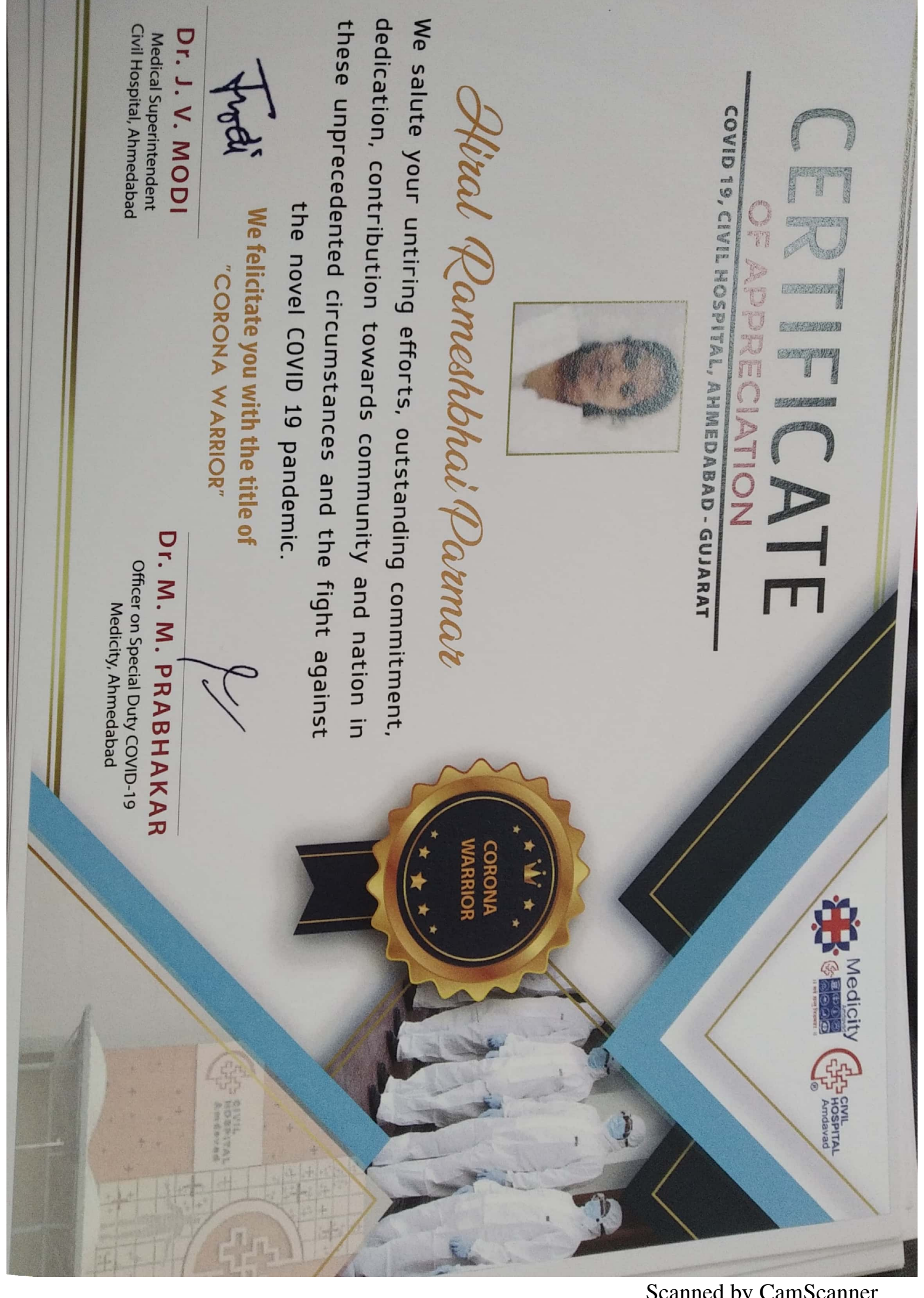
Scanned by CamScanner